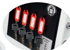
Crochets clés internes

L'image comprend les plateaux multimédias amovibles disponibles en option